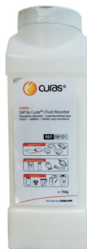
08101 SAP i dispenserflaske