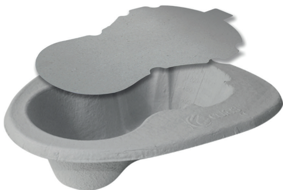
08000 Bækken m/låg 2 l