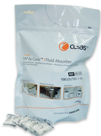
08100 SAP i opløselige poser